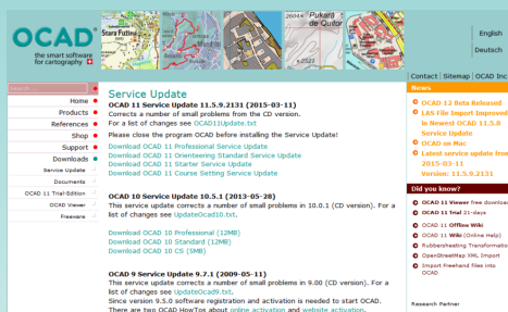
Fig. 3: Servisní update