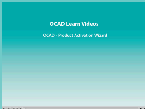
Fig. 1: Výuková videa

Odkaz na nejnovější verze programu OCAD 12 naleznete v položce menu Nápověda nebo na www.ocad.com/en/downloads . Servisní update opravuje chyby programu a implementuje některé nové funkce. Servisní update programu OCAD 12 je zdarma.