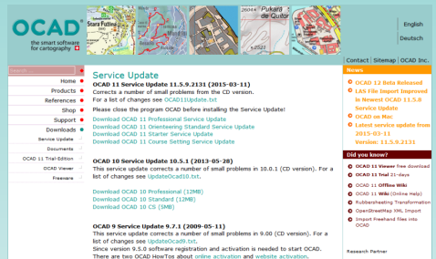
Kuva. 3: Korjauspäivitykset