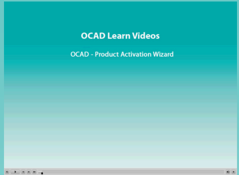
Fig. 1: Lern-Videos

Halten Sie OCAD 12 auf der neusten Stand! Die Service-Updates korrigieren entdeckte Fehler und sind kostenlos. Sie finden die neusten Service-Updates auf unserer Webseite unter www.ocad.com/de/downloads