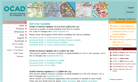
Fig. 3: Service-Update