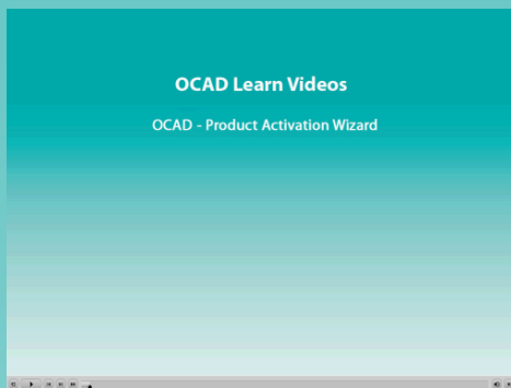
Fig. 1: Vídeos

Mantenha o OCAD 12 atualizado! O serviço de atualização corrige erros detectados. Você encontra de forma gratuita a atualização mais recente em nosso web site www.ocad.com/en/downloads .