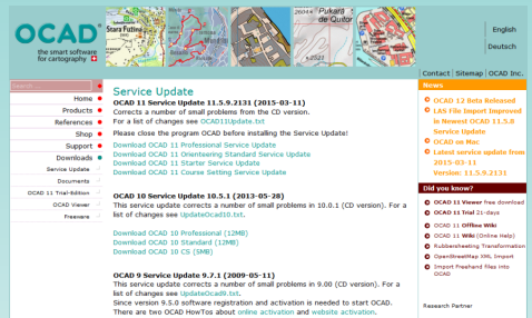
Fig. 3: Service Update