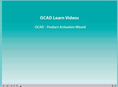
Fig. 1: Utbildningsvideor

Se till att OCAD 12 är uppdaterad! Serviceuppdateringarna korrigerar upptäckta fel i programmet. Du hittar den senaste Serviceuppdateringen på vår hemsida www.ocad.com/en/downloads varifrån du kan ladda ner den helt utan kostnad.